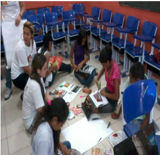
Imagem 4. Construção de cartazes em Bujará

No dia 19 de maio de 2013, foi realizada uma oficina no município de Bujaru, com o tema “Desvendando a sexualidade”, onde foi encontrado principalmente o público jovem a partir de 16 anos, sem limite de idade. Pertencia ao planejamento 5 momentos de envolvimento, realizou-se uma dinâmica de descontração e fez-se explicação sobre sexualidade no dia-a-dia. No momento seguinte foi feita a construção de cartazes pelos participantes com o título “eu e a sexualidade” onde procurou-se a identificação de cada um com seu interior; utilizou-se a música “Amor e Sexo” – Rita Lee, para falar sobre relações afetivas e em seguida foi posto um vídeo explicativo sobre ética e gênero para, só então, abrir o espaço para perguntas e respostas através da “caixa dos segredos”.