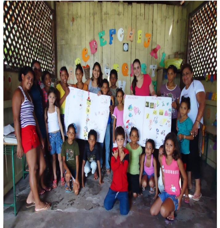
Imagem 2. Educandos do Anexo P. Branca – apresentação de cartazes

É interessante notar, que tivemos duas respostas distintas novamente, as crianças maiores afirmaram que os brinquedos são de todos, já as crianças menores fizeram a divisão entre meninos e meninas. Trabalhamos a noção de brincar em conjunto e de diversão em grupo. Finalizamos esta ação com a “Caixa dos segredos”, na qual as crianças fizeram desenhos e escreveram frases sobre a temática abordada. Esta ação foi muito proveitosa e prazerosa tanto para as crianças quanto para os educadores, pela troca de experiências e de conhecimentos predominantes nas atividades. Entende-se, aqui, a discussão de gênero como o questionar concepções e construções sociais.