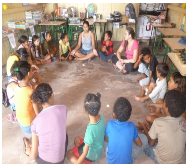
Imagem 1. Círculo dialógico com educandos do Anexo P. Branca

As famílias mais próximas a escola Anexo Pedra Branca tinham em média de 3 a 6 crianças, com idades variadas. No levantamento realizado a problemática mais evidente era referente a Meio Ambiente, porém, após alguns minutos de diálogo com as crianças, principalmente, identificamos questões relevantes para a Educação Sexual, como gravidez precoce, violência doméstica, discriminação de gênero e abandono do lar